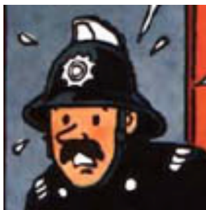
Harry, capitaine des pompiers